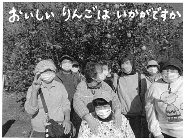
親子参加のりんご狩りは 良いコミュニケーションの場だよ