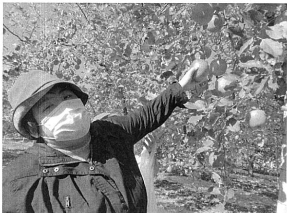
りんごもぎるの 上手になったよ