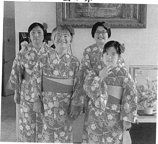
美しく かわいらしくて とても 素敵でした